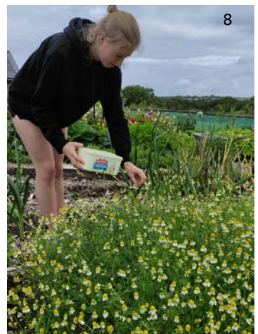
1. Připraveni na cestu 2. Po 1200 km řízení, konečně v Calais 3. Servírování jídla 4. Sklizeň fazolí 5. Večer před odplutím v Calais 6. Vítá nás Dover 7. S naší „rodinou“ na farmě 8. Sklizeň heřmánku