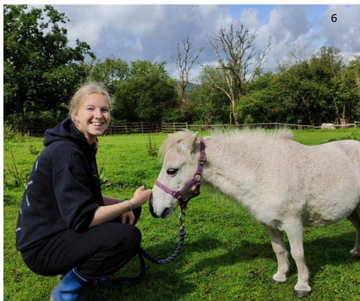
1. Večerní výlet k Atlantiku, pláž Mwnt je ideálním místem na pozorování delfínů 2. Péče ve stáji 3. Záchraná koňská stanice v Brecon Beacons 4. Mytí auta jako zábavná náplň práce 5. V Brecon Beacons na cestě k jezeru Llyn y Fan Fach 6. Péči o poníky děti shodně vyhodnotily jako nejkrásnější zážitek