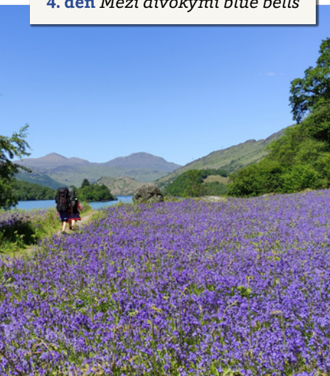
4. den Mezi divokými blue bells