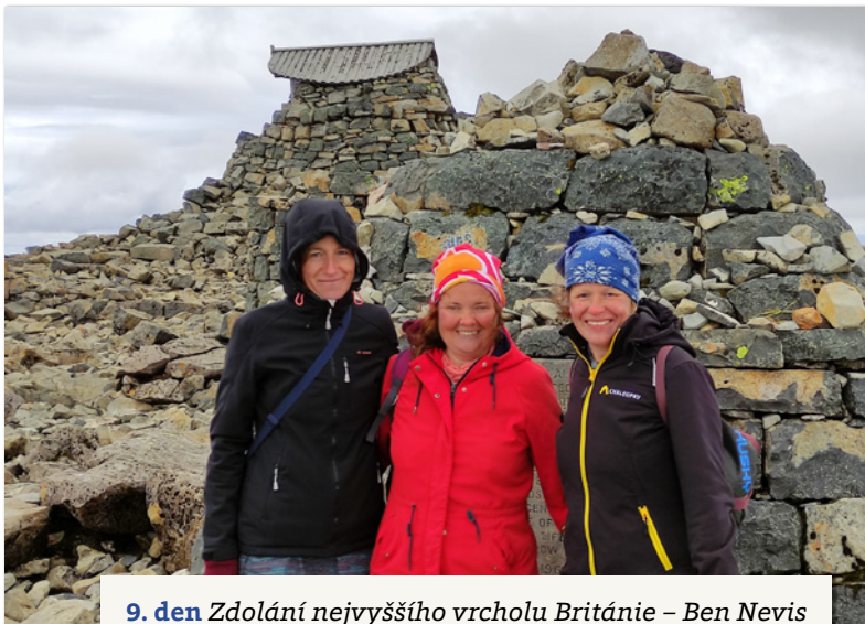
9. den Zdolání nejvyššího vrcholu Británie – Ben Nevis

jezery a potoky, jedna z posledních velkých divočin v Evropě. Nepotkáváme tu žádnou civilizaci a dokážu si představit, že za deštivého a mlhavého počasí může tato oblast působit až děsivě. Obzvláště když procházíme kolem strašidelné zříceniny bývalého stavení s názvem Ba Cottage. Myslím, že Hitchcock by tu našel skvělé kulisy pro své horory. Odtud jdeme raději dále, nějak na nás tohle místo divně působí. Pokračujeme ještě kousek, až narazíme na nádherný starý kamenný mostek Ba Bridge a kolem něho hned několik příznivých plácků na postavení stanu. Potkáváme tu pár z Polska a dvě dámy z Francie, kteří si již prostor na stan našli a zabydleli se, a my využíváme ten poslední. V nohách 19,5 km a spokojené usínáme s červenajícím nebem nad námi.