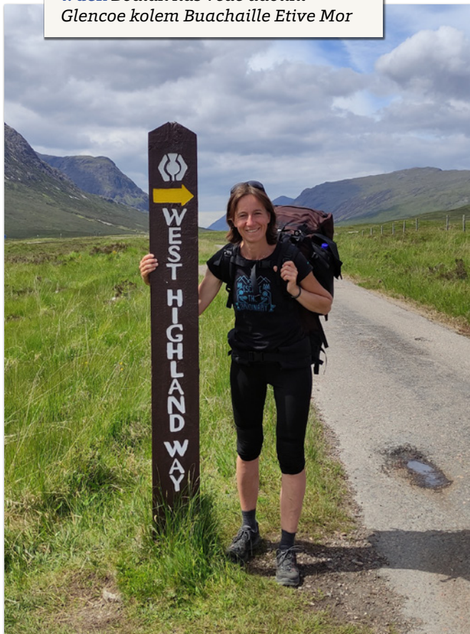
7. den Bodlák nás vede údolím Glencoe kolem Buachaille Etive Mor